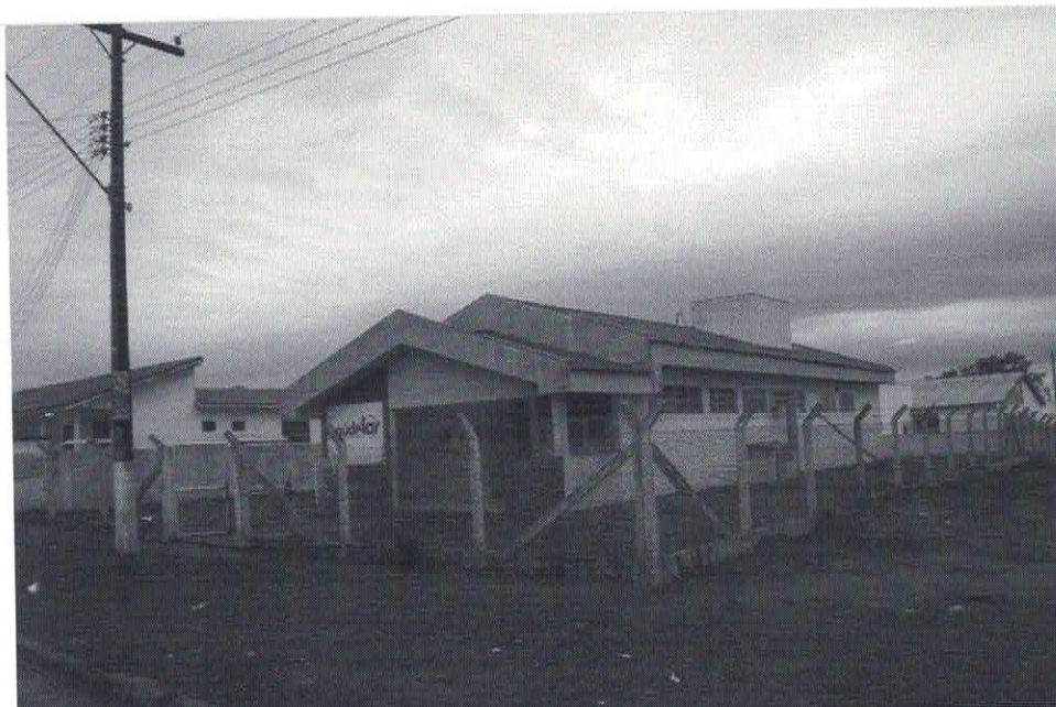
Data da última atualização: 27/12/2018