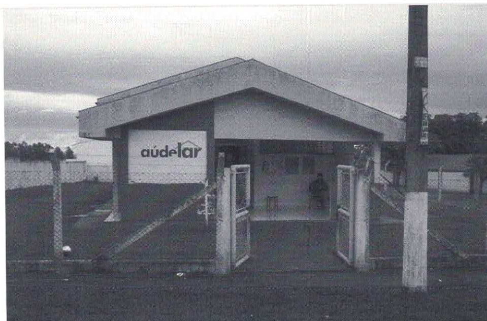
Data da última atualização: 27/12/2018