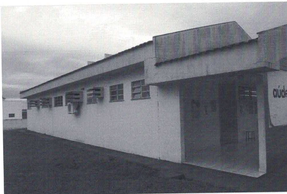
Data da última atualização: 27/12/2018