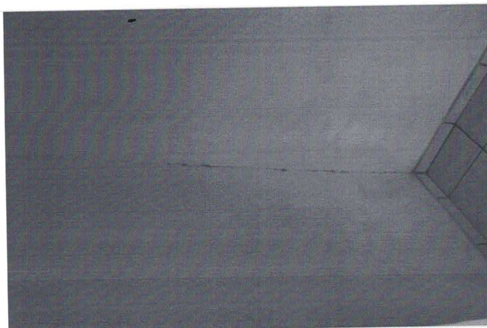
Data da última atualização: 27/12/2018