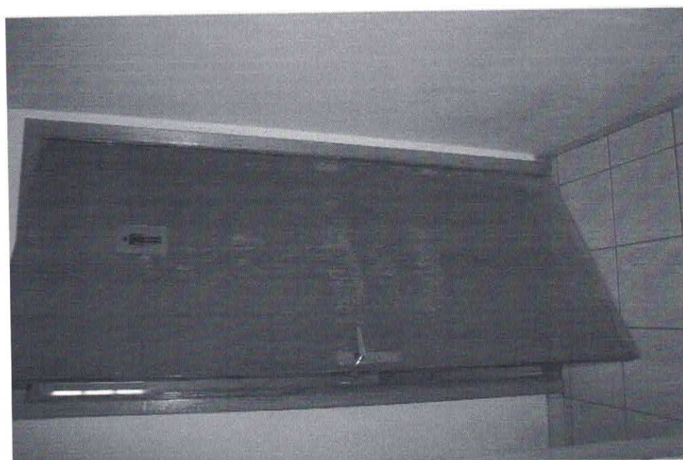
Data da última atualização: 27/12/2018