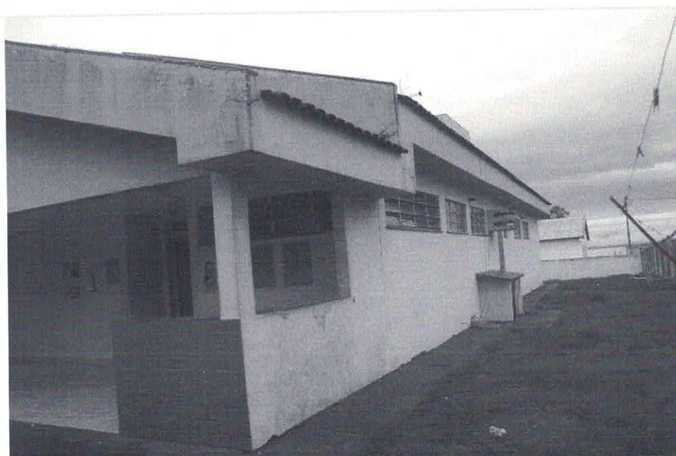
Data da última atualização: 27/12/2018