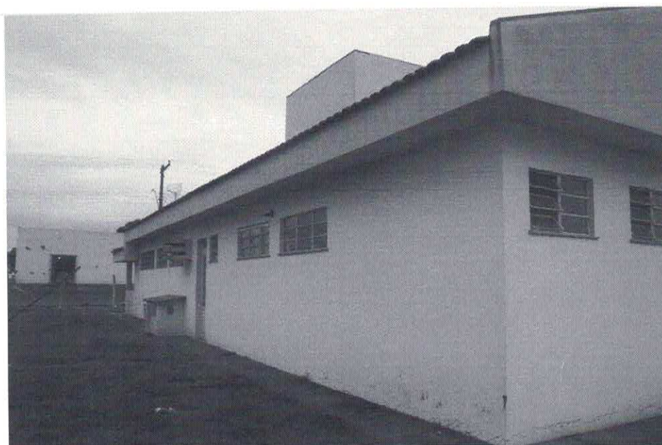
Data da última atualização: 27/12/2018